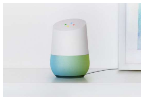
図-1 Google Home

音質を気にしないのであれば私の使っている Mini サイズで十分機能します。（と言っても、Mini サイズでも高音質です。）