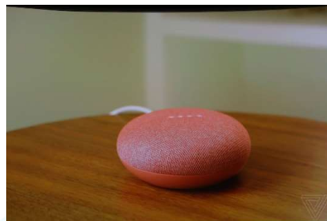
図-2 Google Home mini